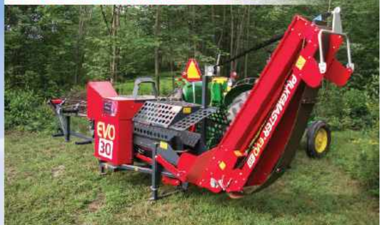
PROCESSEUR À BOIS